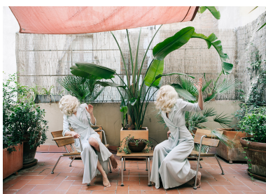
The Terrace © Anja Niemi

Royaume-Uni, écrit par La Rédaction / The Staff