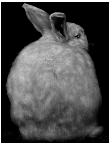
Animal, 2009 © Elliot Ross

Pays-Bas, écrit par La Rédaction / The Staff